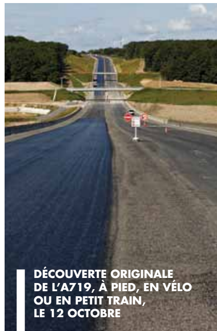
DÉCOUVERTE ORIGINALE DE L'A719, À PIED, EN VÉLO OU EN PETIT TRAIN, LE 12 OCTOBRE

Mise en service début 2015 , cette bretelle de 14 km nous rapprochera de l'A71 et de Clermont-Fd. Un plus pour l'attrait économique et touristique de l'agglomération. ■