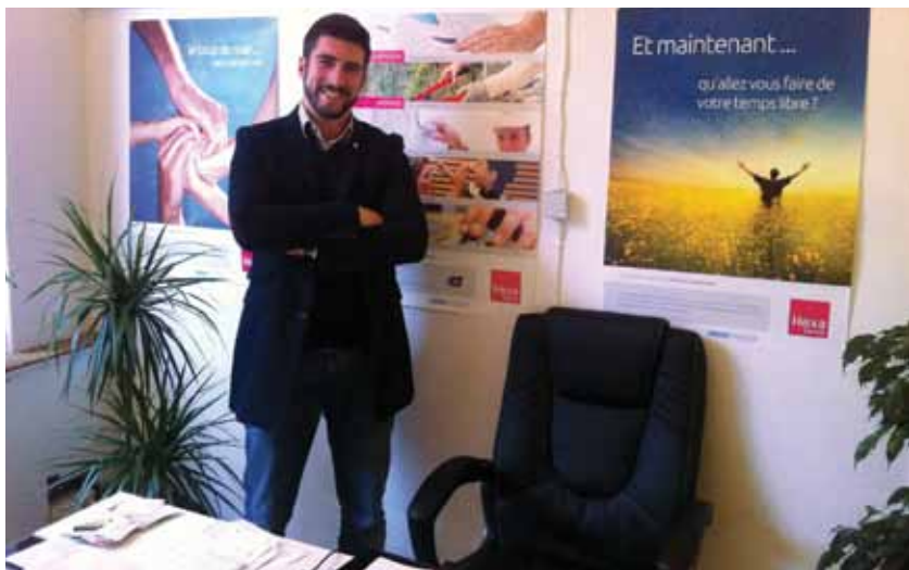
HEXA SERVICE PROPOSE AUX ENTREPRISES D'OFFRIR À LEURS SALARIÉS DES PRESTATIONS DE SERVICE À DOMICILE

Leur crédo : vous servir. L'une, Hexa Service, est une toute jeune société franchisée qui propose à ses clients des services à la personne ( travaux ménagers, jardinage, bricolage, assistance informatique, etc ) en partie défiscalisés, l'autre, AREM ( atelier de réparation électroménager ), fondée en 1963, répare, vend des pièces détachées et des appareils électroménagers, sur fond d'obsolescence programmée.