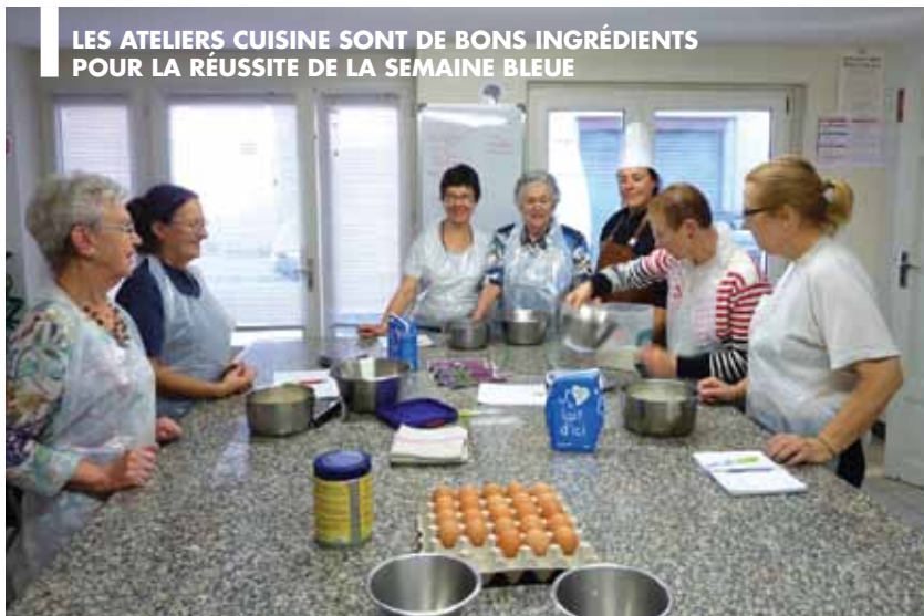
LES ATELIERS CUISINE SONT DE BONS INGRÉDIENTS POUR LA RÉUSSITE DE LA SEMAINE BLEUE

C'est devenu le rendez-vous de l'automne pour les seniors : la Semaine bleue (3 ème édition) organisée par le Centre Communal d'Action Sociale (CCAS) est un concentré des services proposés toute l'année à nos aînés.