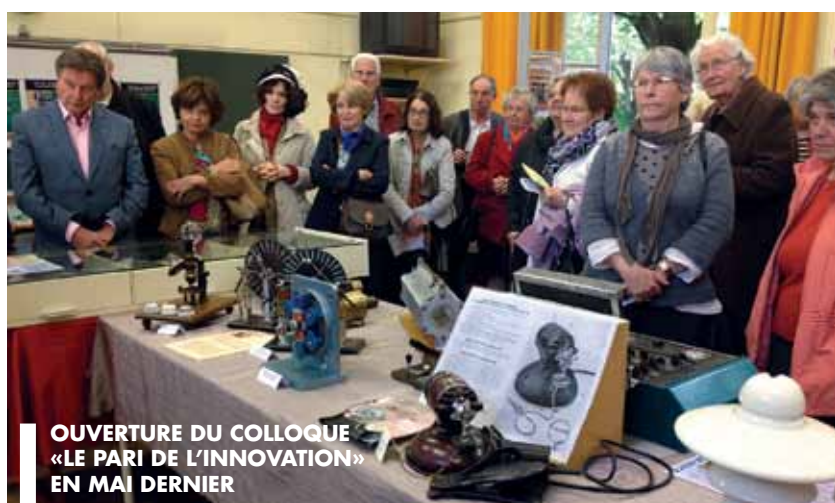
OUVERTURE DU COLLOQUE «LE PARI DE L'INNOVATION» EN MAI DERNIER

Depuis bientôt trente ans, l'Université indépendante de Vichy (UIV) cultive avec succès les chemins de la connaissance. Près de cent dix matières y sont enseignées sous forme de cours, d'ateliers et de séminaires.