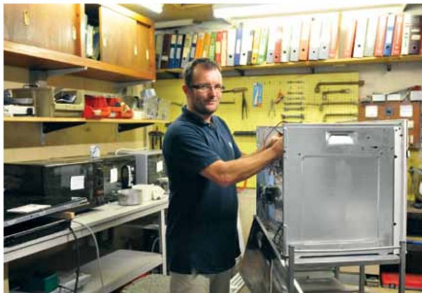
AREM FAIT DURER PLUS LONGTEMPS NOS APPAREILS ÉLECTROMÉNAGERS

HEXA - 23 passage du Commerce Contact : 06.41.68.49.47 n.subjobert@hexa-service.com www.hexa-service.com