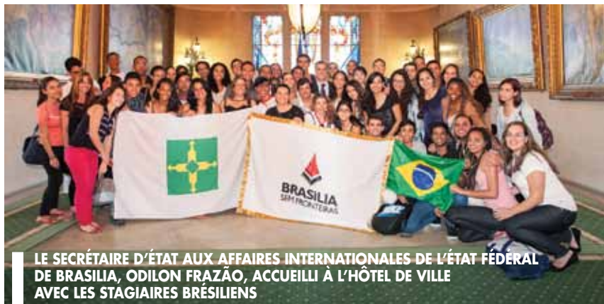
LE SECRÉTAIRE D'ÉTAT AUX AFFAIRES INTERNATIONALES DE L'ÉTAT FÉDÉRAL DE BRASILIA, ODILON FRAZÃO, ACCUEILLI À L'HÔTEL DE VILLE AVEC LES STAGIAIRES BRÉSILIENS