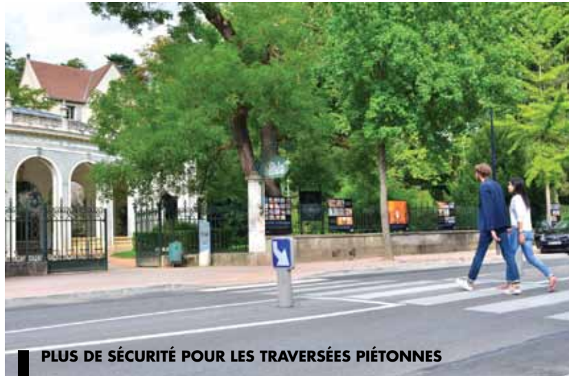
PLUS DE SÉCURITÉ POUR LES TRAVERSÉES PIÉTONNES