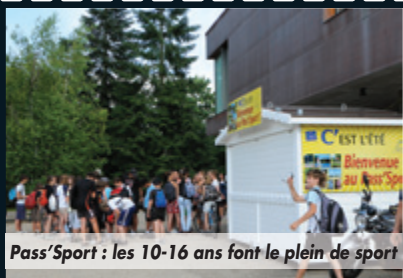
Pass'Sport : les 10-16 ans font le plein de sport