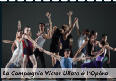
La Compagnie Victor Ullate à l'Opéra