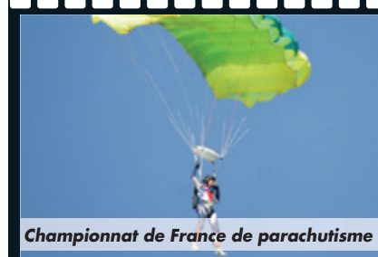
Championnat de France de parachutisme