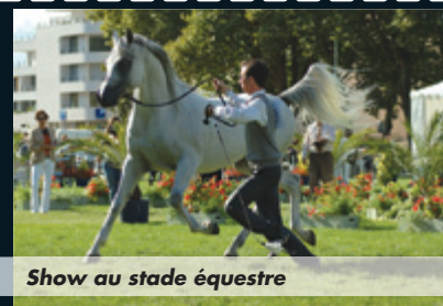
Show au stade équestre