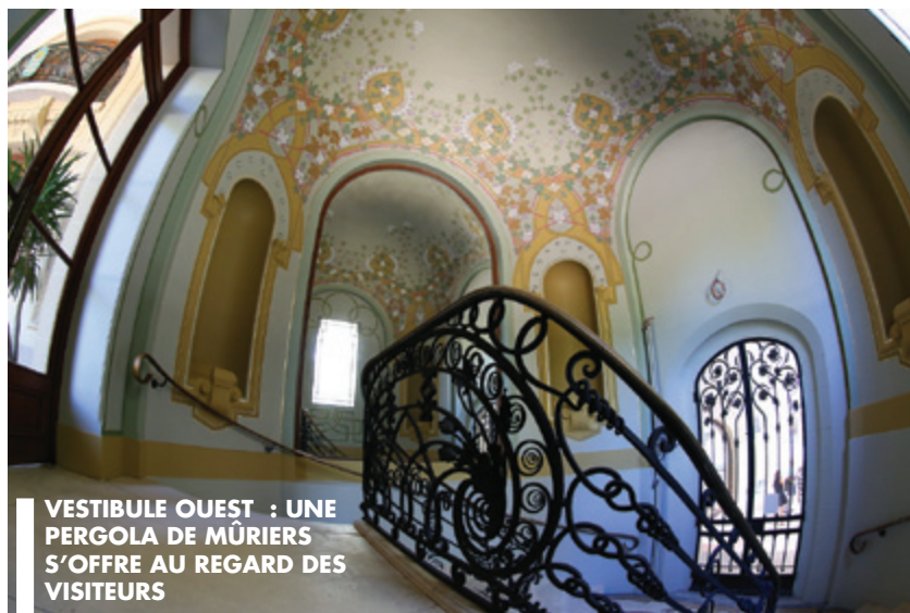
VESTIBULE OUEST : UNE PERGOLA DE MÛRIERS S'OFFRE AU REGARD DES VISITEURS