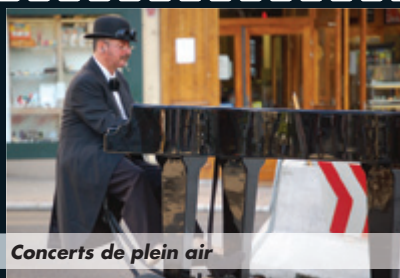
Concerts de plein air