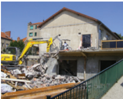
A LYAUTEY, LES TRAVAUX DE DÉMOLITION SONT ACHEVÉS

Rappelons que cet axe routier reliera à terme le quartier Beausoleil à Creuzier-le-Vieux et les quartiers des Garets à Vichy et Puybessieu à Cusset. Il a pour objectifs de faciliter la traversée de Cusset et Vichy et d'améliorer la qualité de vie des riverains des boulevards Denière, et des Graves.