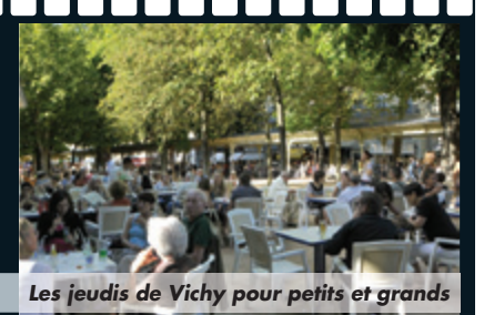
Les jeudis de Vichy pour petits et grands

cérémonie d'ouverture des Jeux Olympiques de Londres et les commentateurs Denis Brogniart et Gilles Bouleau de TF1 soulignent que le nageur américain Mickaël Phelps a fait sa préparation à Vichy. Quand on connaît le palmarès de Phelps, le sportif le plus médaillé des JO, c'est la plus belle des récompenses en termes de notoriété et d'image pour notre ville et pour les nombreux profes-