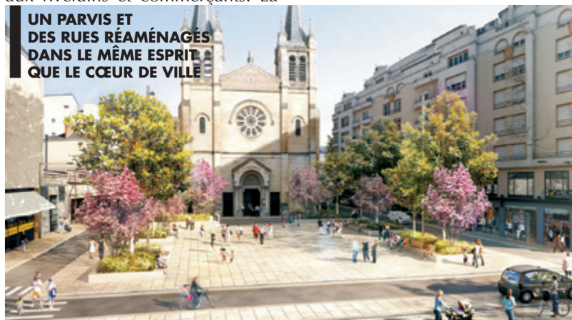
UN PARVIS ET DES RUES RÉAMÉNAGÉS DANS LE MÊME ESPRIT QUE LE CŒUR DE VILLE

Les élèves de maternelle ont fait leur rentrée dans leurs trois classes respectives dont une nouvelle aménagée à l'étage en juillet pour permettre le chantier de rénovation et d'extension de l'école. Au mois d'août les opérations de déconstruction démolition, tri et évacuation des gravats se sont succédé. La nouvelle extension côté cour est maintenant en cours de construction. Pour perturber au minimum la classe, les rénovations intérieures des locaux existants se feront sur les périodes de congés scolaires. En septembre 2013, les petits vichyssois feront leur rentrée dans leur école «new look».