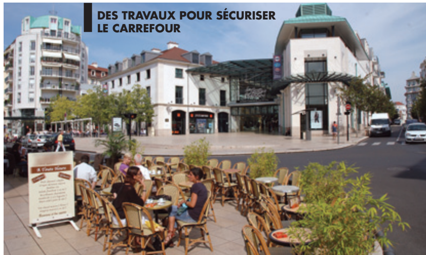
DES TRAVAUX POUR SÉCURISER LE CARREFOUR