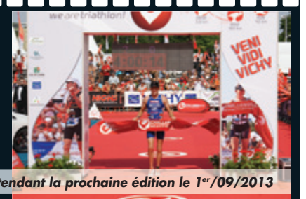
VENI VIDI VICHY