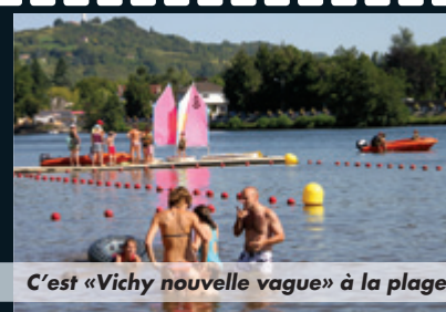
C'est «Vichy nouvelle vague» à la plage