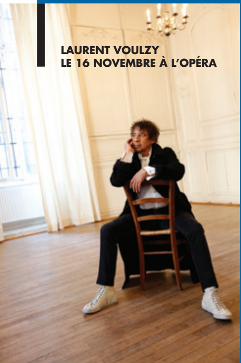
LAURENT VOULZY LE 16 NOVEMBRE À L'OPÉRA

LAURENT VOULZY LYS & LOVE Après dix ans d'attente, Laurent Voulzy revient avec «Lys & Love», un album atypique, aventureux et envoûtant ! Renseignements et réservations : 04 70 30 50 30 - E.mail : billetterie.opera@ville-vichy.fr