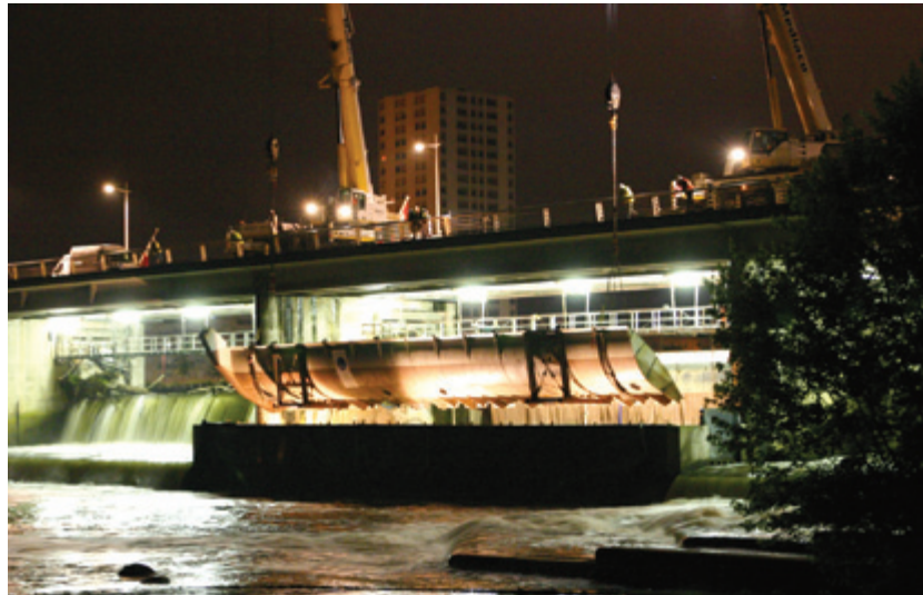
LE CLAPET N°2, UN MONSTRE D'ACIER DE 40 TONNES À ÉTÉ DÉPOSÉ DANS LA NUIT DU 4 AU 5 JUILLET. SON REMPLAÇANT SERA POSÉ DÉBUT NOVEMBRE

Depuis la spectaculaire dépose de l'ancien clapet dans la nuit du 4 au 5 juillet derniers, les interventions sur le génie civil se poursuivent, plus discrètement, dans l'enceinte du clapet n°2. Fin octobre, tout sera ainsi prêt pour recevoir le nouveau mécanisme de manœuvre du clapet (vérin hydraulique au lieu du treuil et de la chaîne galle) et le nouveau clapet dans la semaine du 5 novembre. Le pont devra être fermé une journée complète à la circulation pour pouvoir descendre à son emplacement le nouveau clapet (de 30 m de long sur 7 m de hauteur) et le positionner précisément. ■