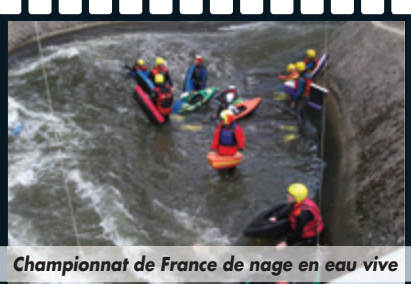
Championnat de France de nage en eau vive