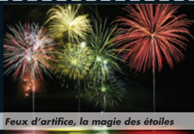
Feux d'artifice, la magie des étoiles