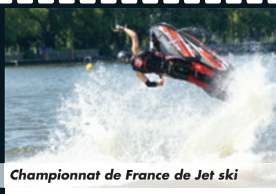
Championnat de France de Jet ski