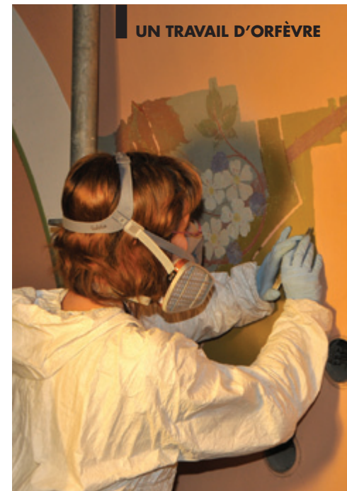
UN TRAVAIL D'ORFÈVRE