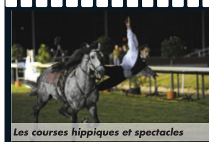
Les courses hippiques et spectacles