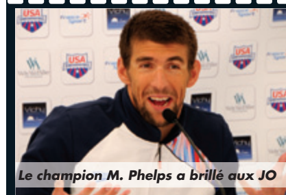
Le champion M. Phelps a brillé aux JO