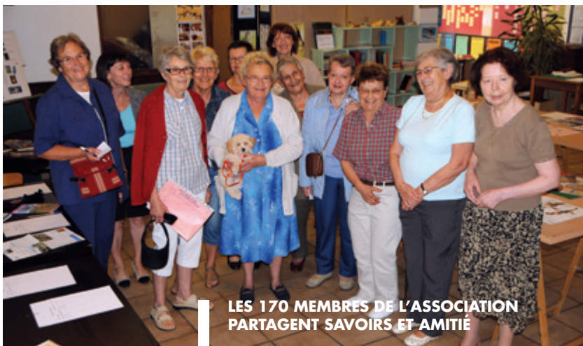
LES 170 MEMBRES DE L'ASSOCIATION PARTAGENT SAVOIRS ET AMITIÉ

L'association vichyssoise Échanges de Savoirs Alice Couzinet fête ses vingt ans d'existence. Deux décennies placées sous le signe de la réciprocité pendant lesquelles ses membres auront échangé leurs connaissances dans les domaines les plus variés, de l'informatique au tricot.