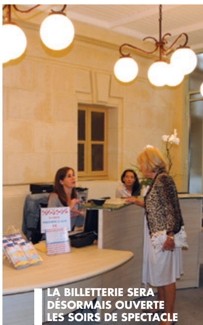
LA BILLETTERIE SERA DÉSORMAIS OUVERTE LES SOIRS DE SPECTACLE