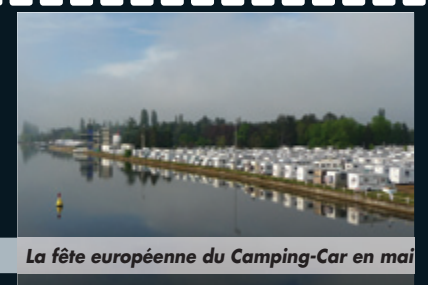
La fête européenne du Camping-Car en mai