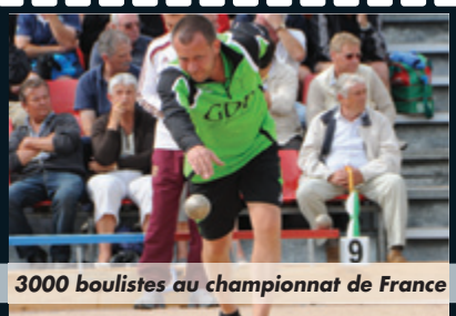
3000 boulistes au championnat de France