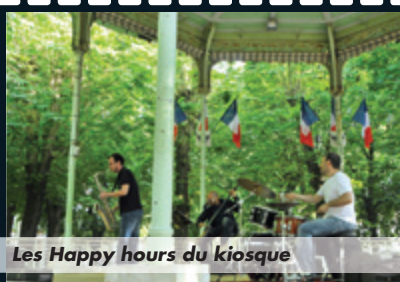
Les Happy hours du kiosque