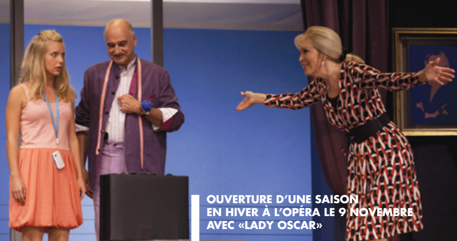
OUVERTURE D'UNE SAISON EN HIVER À L'OPÉRA LE 9 NOVEMBRE AVEC «LADY OSCAR»