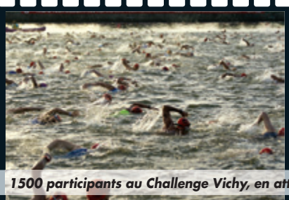
1500 participants au Challenge Vichy, en attendant la prochaine édition le 1 er /09/2013