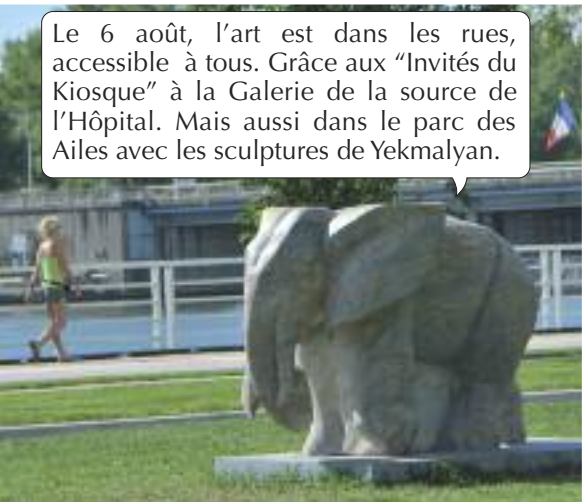
Le 6 août, l'art est dans les rues, accessible à tous. Grâce aux "Invités du Kiosque" à la Galerie de la source de l'Hôpital. Mais aussi dans le parc des Ailes avec les sculptures de Yekmalyan.