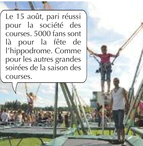
Le 15 août, pari réussi pour la société des courses. 5000 fans sont là pour la fête de l'hippodrome. Comme pour les autres grandes soirées de la saison des courses.