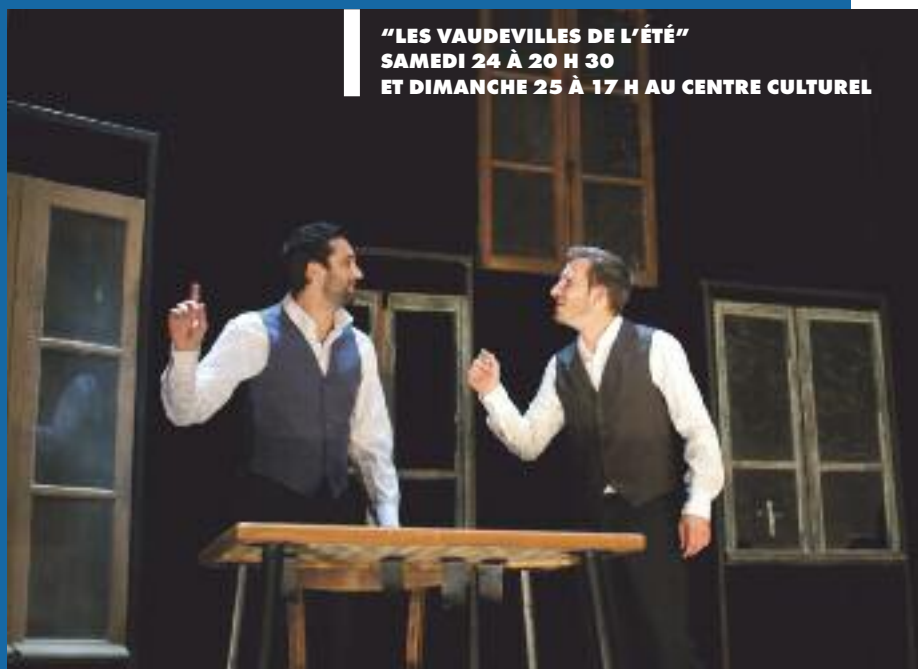
"LES VAUDEVILLES DE L'ÉTÉ" SAMEDI 24 À 20 H 30 ET DIMANCHE 25 À 17 H AU CENTRE CULTUREL

• Palais du Lac 15 ème Rencontre Internationale d'Aquariophilie organisée par le club d'Aquariophilie et Terrariophilie de Vichy Le 1 er octobre de 9 h 30 à 12 h et de 14 h à 18 h, conférences et visite des exposants.