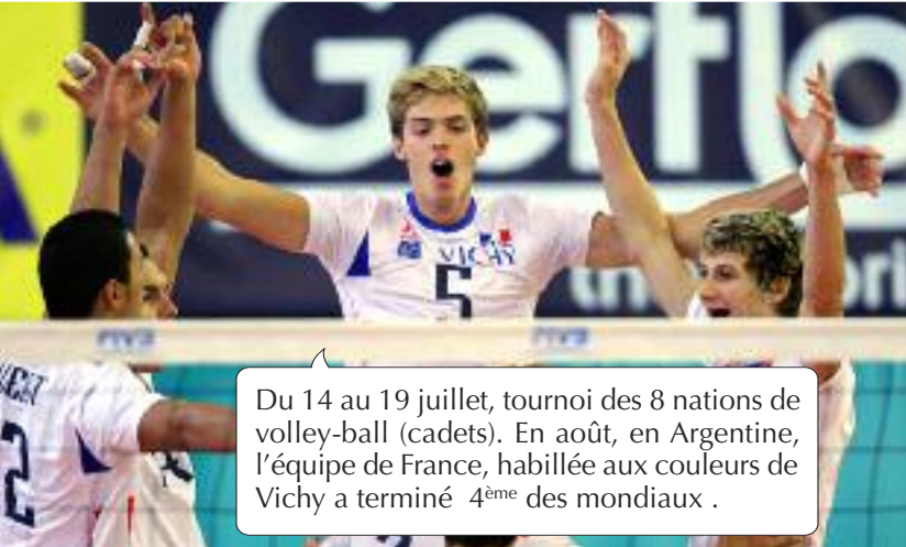
Du 14 au 19 juillet, tournoi des 8 nations de volley-ball (cadets). En août, en Argentine, l'équipe de France, habillée aux couleurs de Vichy a terminé 4 ème des mondiaux.