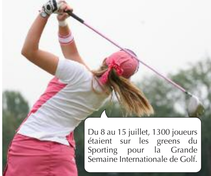
Du 8 au 15 juillet, 1300 joueurs étaient sur les greens du Sporting pour la Grande Semaine Internationale de Golf.