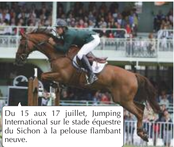
Du 15 aux 17 juillet, Jumping International sur le stade équestre du Sichon à la pelouse flambant neuve.