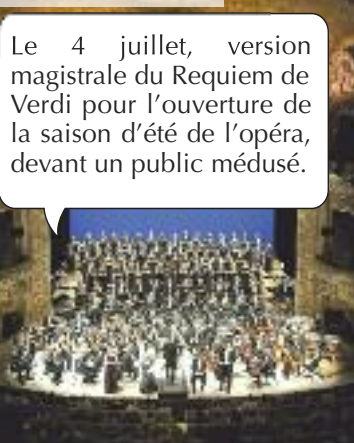
Le 4 juillet, version magistrale du Requiem de Verdi pour l'ouverture de la saison d'été de l'opéra, devant un public médusé.