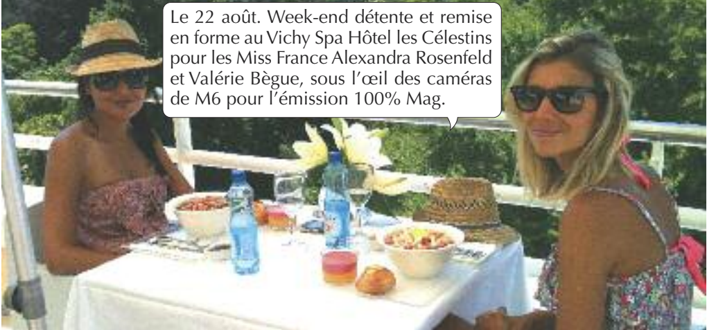
Le 22 août. Week-end détente et remise en forme au Vichy Spa Hôtel les Célestins pour les Miss France Alexandra Rosenfeld et Valérie Bègue, sous l'œil des caméras de M6 pour l'émission 100% Mag.