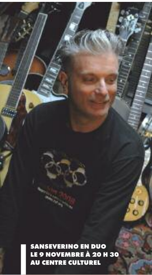
SANSEVERINO EN DUO LE 9 NOVEMBRE À 20 H 30 AU CENTRE CULTUREL