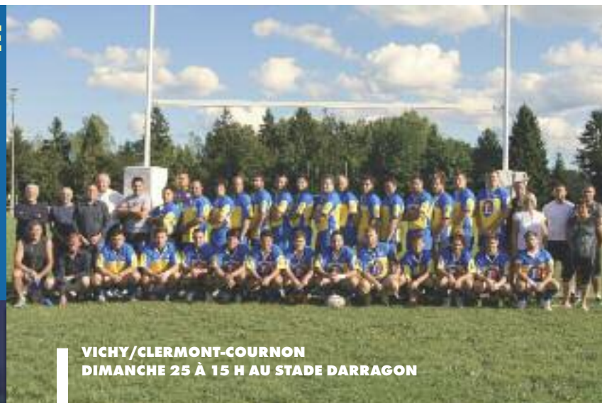
VICHY/CLERMONT-COURNON DIMANCHE 25 À 15 H AU STADE DARRAGON

Concert samedi à 16 h au parc omnisports et messe en musique en l'Église Saint-Louis le dimanche 25 à 10 h, animations musicales gratuites proposées par les anciens de la musique de la Garnison d'Alger dans le cadre du 36 e congrès de l'association