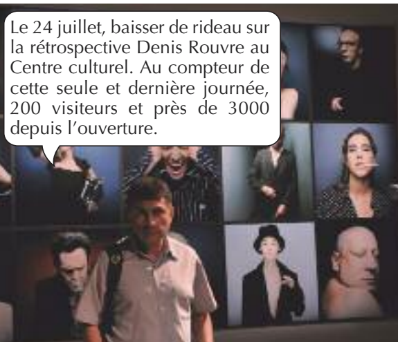
Le 24 juillet, baisser de rideau sur la rétrospective Denis Rouvre au Centre culturel. Au compteur de cette seule et dernière journée, 200 visiteurs et près de 3000 depuis l'ouverture.