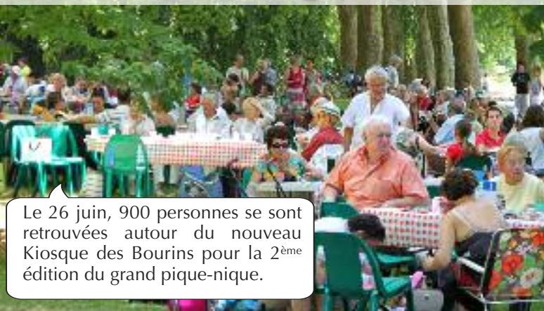
Le 26 juin, 900 personnes se sont retrouvées autour du nouveau Kiosque des Bourins pour la 2 ème édition du grand pique-nique.