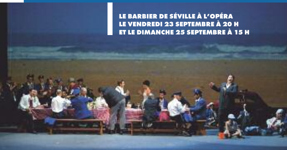
LE BARBIER DE SÉVILLE À L'OPÉRA LE VENDREDI 23 SEPTEMBRE À 20 H ET LE DIMANCHE 25 SEPTEMBRE À 15 H

Mise en scène et scénographie, Adriano Sinivia, Direction Jean Yves Ossonce, Chef de Chœur, Véronique Carrot Vendredi un cocktail sera offert en partenariat avec La Table de Jean-Baptiste