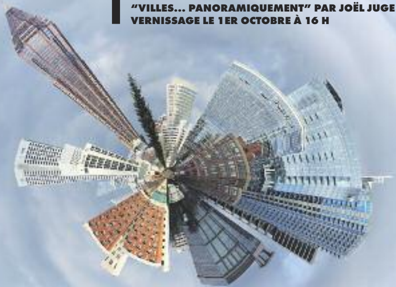
"VILLES... PANORAMIQUEMENT" PAR JOËL JUGE VERNISSAGE LE 1ER OCTOBRE À 16 H

MUSÉE SURREALISTE FRANÇOIS BOUCHEIX 7, rue Sornin - 04 70 31 49 92 www.boucheix.com