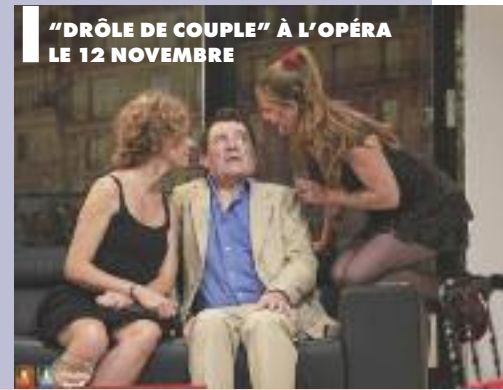
"DRÔLE DE COUPLE" À L'OPÉRA LE 12 NOVEMBRE

• 15 h - Stade Darragon Rugby Vichy/Montmélian