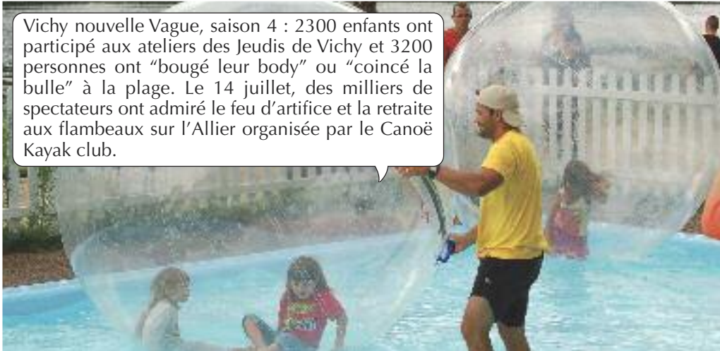
Vichy nouvelle Vague, saison 4 : 2300 enfants ont participé aux ateliers des Jeudis de Vichy et 3200 personnes ont "bougé leur body" ou "coincé la bulle" à la plage. Le 14 juillet, des milliers de spectateurs ont admiré le feu d'artifice et la retraite aux flambeaux sur l'Allier organisée par le Canoë Kayak club.